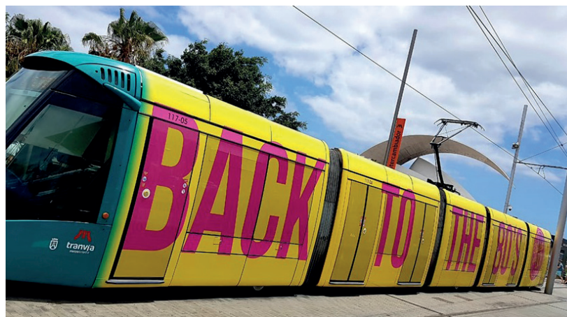
Los ingresos por rotulación de tranvías aumentaron más de un 30 % respecto al anterior ejercicio.

Nuestras unidades circulan 365 días del año por las zonas más céntricas de Santa Cruz y La Laguna, por lo que es incalculable el número de transeúntes y/o pasajeros que se cruzan diariamente con este tipo de publicidad móvil.