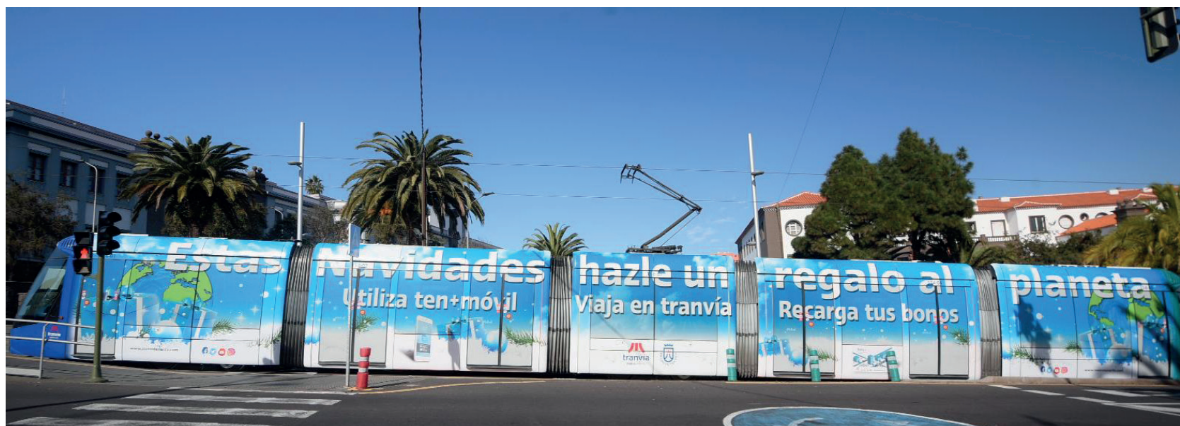
‘Hazle un regalo al planeta. Viaja en tranvía’ fue una campaña que hemos trabajado y desarrollado en coordinación con jóvenes.

Dichas acciones publicitarias tuvieron una notable repercusión, ya que se difundieron en nuestras redes sociales y en nuestro canal de Youtube (Tranvía de Tenerife), además de su publicación en todas las paradas, mupis y cristalerías de marquesinas, y en tranvías con la rotulación de la imagen de las campañas.