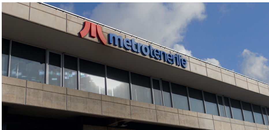
Más del 66 % de los empleados se sitúa en el tramo de edad de 40 a 49 años.

-1 técnico de Mantenimiento de Material Móvil. (Bolsa de trabajo de 5 plazas) -1 técnico de Mantenimiento de Instalaciones Fijas. (Bolsa de trabajo de 5 plazas)