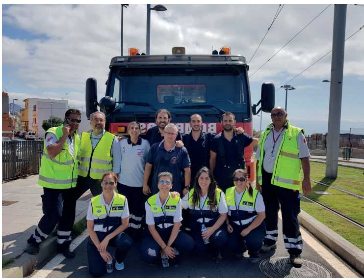
A través del simulacro de accidente hemos evaluado los protocolos de comunicación, información y operatividad, así como la coordinación con los agentes externos involucrados.

Emergencias y Desastres del Colegio Oficial de Psicología y la Policía Local de santacrucera.