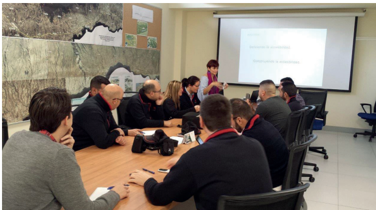
El plan formativo contabilizó más de 8.800 horas de capacitación y 300 asistentes.

En línea con esta labor formativa, nos gustaría destacar el simulacro de emergencia en la Línea 2 que realizamos en el mes de junio con el objetivo principal de comprobar la operatividad de nuestro Plan de Actuación ante Emergencias. El simulacro recreó un atropello múltiple de cuatro personas, quedando una de ellas atrapada bajo el tranvía, y en él participaron: 112 Canarias, Consorcio de Bomberos de Tenerife, Protección Civil del Ayuntamiento de Santa Cruz, Servicio de Urgencias Canario, vocal de Crisis,