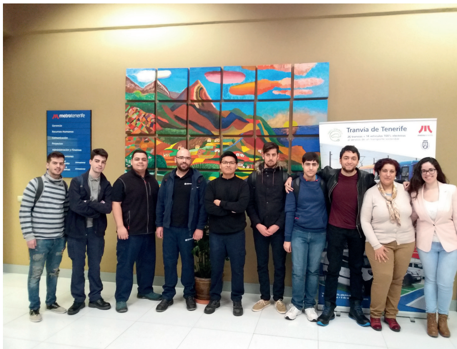
En 2018 hemos recibidos a 31 alumnos en prácticas y/o becarios de 9 centros educativos.