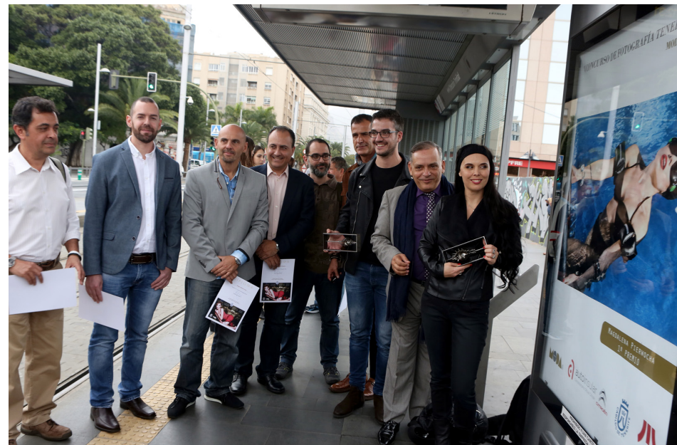
Las fotos finalistas del concurso Tenerife Moda fueron expuestas en nuestras paradas.

Ésta fue la primera reunión de la ronda de encuentros que mantuvimos a lo largo de 2016 con las principales asociaciones de vecinos de la zona, asociaciones de comerciantes, centros educativos y otros colectivos interesados en conocer nuestro proyecto de ampliación de la Línea 2. En total se organizaron 13 encuentros a los que asistieron más de medio millar de personas.