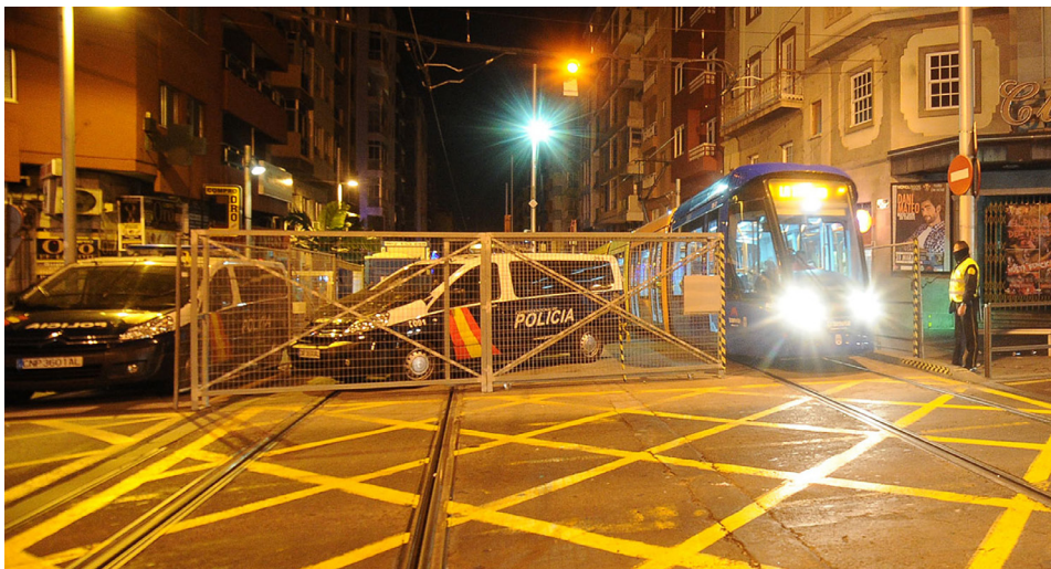
Nueva sentencia condenatoria por daños materiales ocasionados a uno de nuestros tranvías y que ascendieron a más de 5.000 euros.