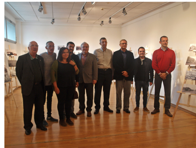
Con nuestra colaboración, la Asociación de Vecinos La Cuesta de Argujón organizó una exposición para recordar la historia del antiguo tranvía que circuló entre Santa Cruz y Tacoronte durante la primera mitad del siglo pasado.

🕒 La Asociación de Vecinos La Cuesta de Argujón contó con nuestra colaboración y la del Ayuntamiento de La Laguna para organizar en el Centro Multifuncional El Tranvía la exposición fotográfica 'El Antiguo Tranvía de Tenerife' en la que se mostraron unas interesantes imágenes seleccionadas por el historiador Rafael Cedrés.