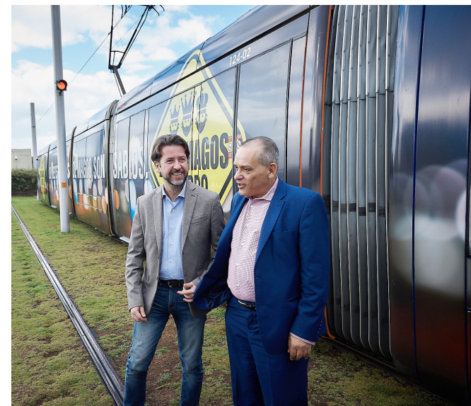
La campaña pretende fomentar el uso del transporte público y las compras en los comercios cercanos del área metropolitana.

🕒 Como cada año pusimos en marcha la campaña de Navidad con el respaldo del Cabildo Insular de Tenerife y la colaboración de Zona Comercial Tranvía, bajo el lema ‘Los Reyes, además de Magos, son sabios’, con el objetivo de fomentar el uso del tranvía entre los ‘ayudantes’ de sus Majestades de Oriente, por ser un transporte competitivo y eficaz en el área metropolitana, y también para fomentar las compras navideñas en los comercios cercanos de Santa Cruz y La Laguna.