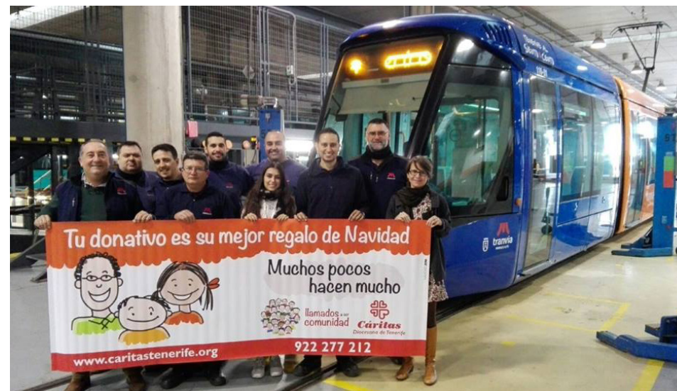
Apoyamos a Cáritas en su campaña 'Muchos pocos hacen mucho' para impulsar la participación ciudadana en proyectos sociales.