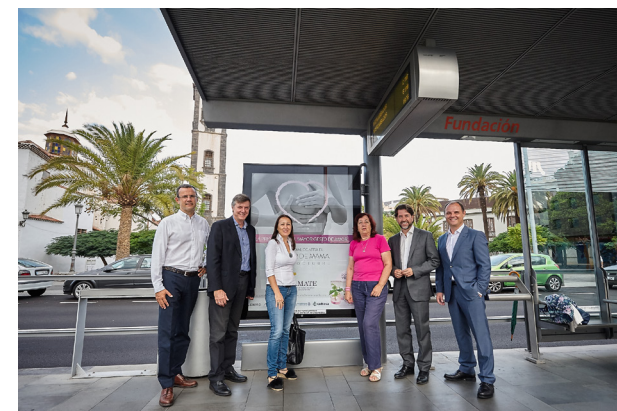
Colaboramos en la difusión de la campaña de Ámate 'La prevención, el mayor gesto de amor' a través de nuestras redes sociales y en las paradas del tranvía.

A través de nuestro Plan de Responsabilidad Social hemos colaborado un año más con la Asociación Contra el Cáncer de Mama de Tenerife (Ámate) en su 'Semana Rosa', un programa de actividades organizado por la asociación para concienciar a la sociedad tinerfeña sobre esta patología.