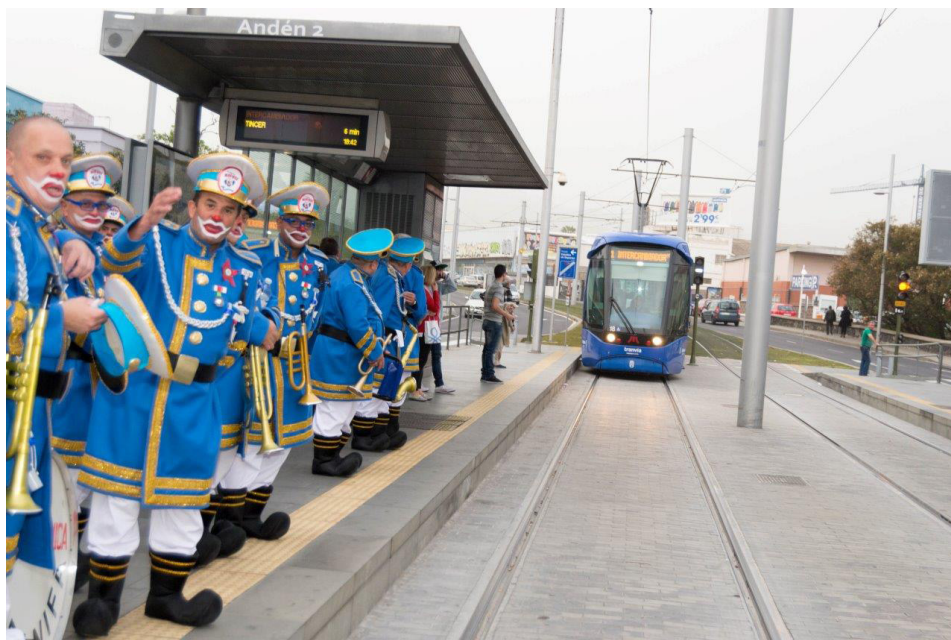
El servicio de Carnaval registró un crecimiento de la demanda del 8,65 % respecto a 2015.

Cada noche de Carnaval, cerca de 10.000 personas confiaron en nuestro tranvía para desplazarse a esta fiesta por lo que el servicio nocturno obtuvo un crecimiento cercano al 5 %, mientras que las jornadas del Carnaval de Día registraron un incremento del 11,69 %, en comparación con 2015, con más de 20.000 personas al día.