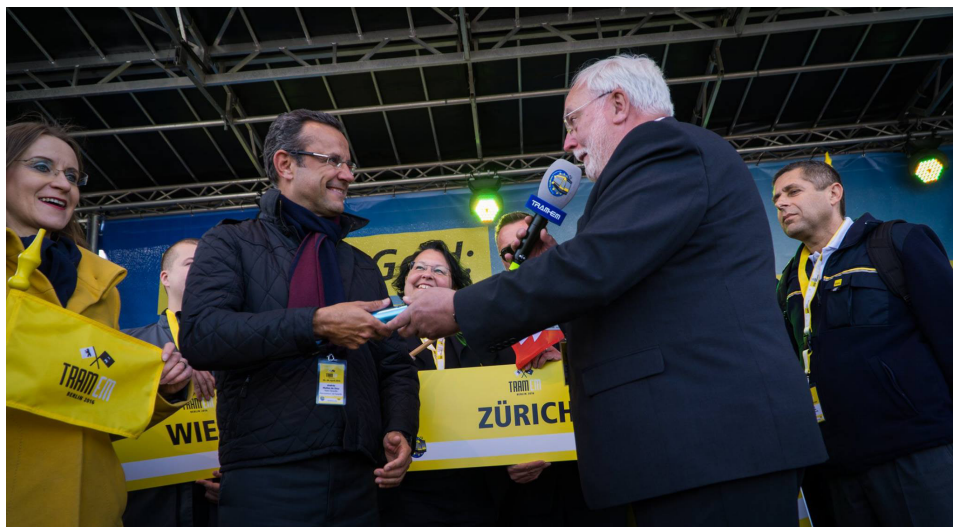
Nuestro gerente recoge el testigo, en Berlín, para celebrar el próximo año la sexta edición del campeonato de conductores en Tenerife coincidiendo con nuestro 10º Aniversario.

Coincidiendo con nuestro 10º Aniversario, esta competición traerá a la isla a los operadores de los principales tranvías de Europa.