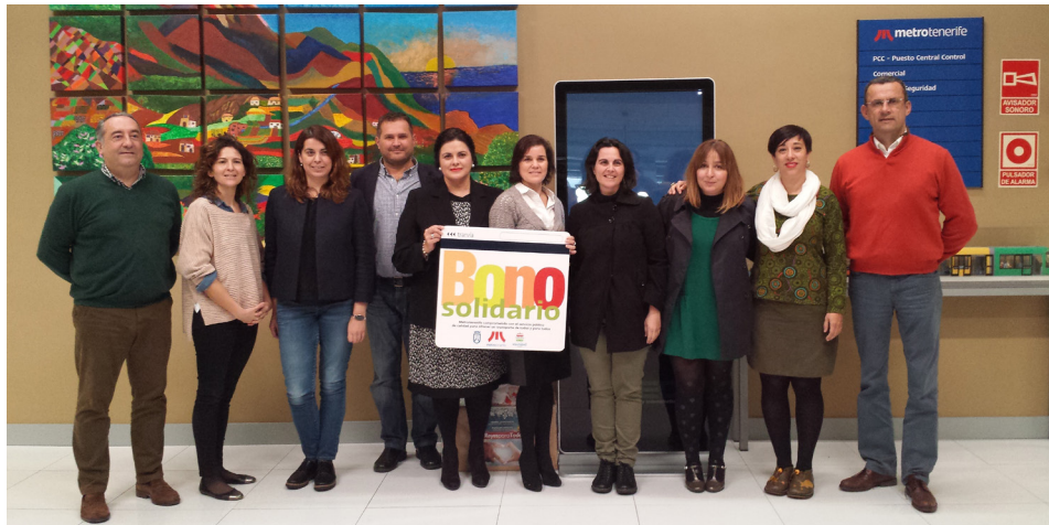
Las colaboraciones con los colectivos de la solidaridad y discapacidad se incluyen en nuestro Plan de Responsabilidad Social.