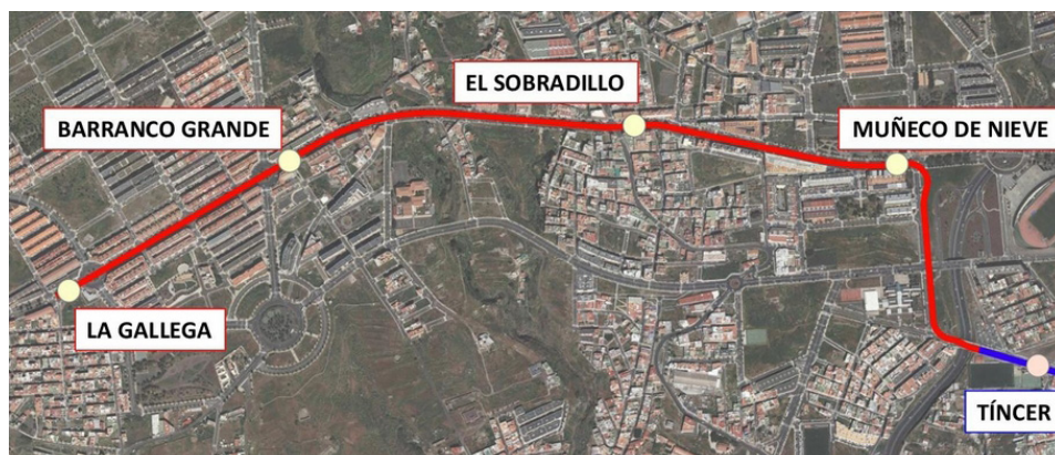
La población servida por la ampliación de la Línea 2 sería de más de 14.000 vecinos de los barrios de La Gallega y El Sobradillo.

Esta ampliación supondría 2,5 kilómetros más de trazado para la Línea 2 y contaría con cuatro nuevas paradas (Muñeco de Nieve, El Sobradillo, Barranco Grande y La Gallega). De acuerdo a los estudios comerciales, la población servida sería de más de 14.000 habitantes y la demanda diaria rozaría los 3.000 usuarios, que se unirían a otros tantos que ya utilizan la actual Línea 2 en servicio. Asimismo, el Consejo también adjudicó los servicios de seguridad y vigilancia a la empresa Ilunion Seguridad S. A. y los de transportes de fondos a Prosegur Servicios de Efectivo España, S. L.