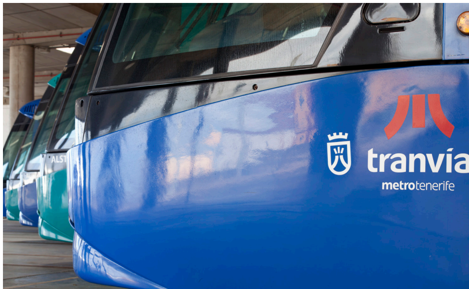
El proceso de selección para Técnico de Proyectos Internacionales permitió la creación de una lista de reserva.