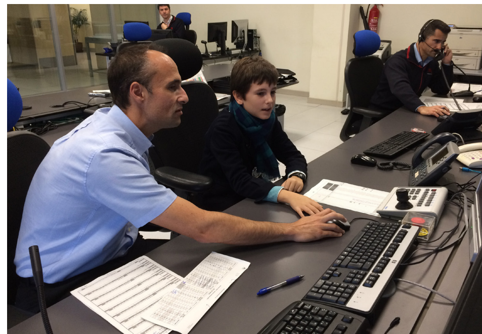
Recibimos al pequeño 'Presidente por un día', iniciativa anual del Cabildo Insular de Tenerife.

'Presidente por un día' es una iniciativa de la Corporación insular para ofrecer a los más pequeños la oportunidad de conocer y ser protagonistas del desarrollo de la isla en la que viven.