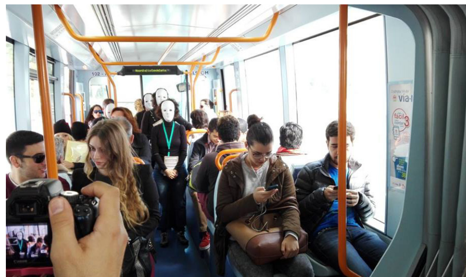
Cáritas Tenerife eligió nuestro tranvía para la difusión de la campaña 'Hazme visible. Por dignidad, nadie sin hogar' dedicada a las personas sin hogar.

Bajo el lema 'Hazme visible. Por dignidad, nadie sin hogar', Cáritas realizó de manera simultánea un flashmob en numerosas ciudades de toda España con motivo del Día Internacional de las Personas sin Hogar. En el caso de Tenerife, Cáritas escogió nuestro tranvía para difundir entre los pasajeros esta campaña en la que se propugna un modelo de sociedad diferente y que se haga realidad que toda persona viva con dignidad en un hogar propio.