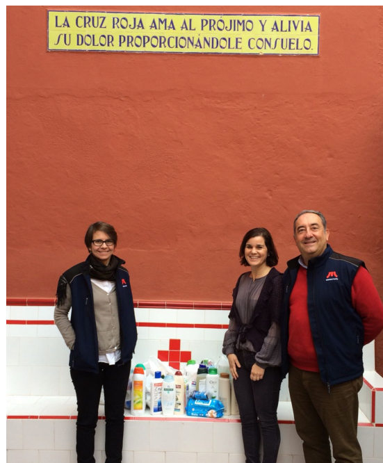
Nuestra plantilla dona diversos productos de higiene personal para un asilo de La Laguna.

Con nuestra donación, así como las realizadas por otras empresas y particulares, Cruz Roja consiguió ayudar a 1.500 familias de la provincia de Santa Cruz de Tenerife, llegando a 4.500 niños y a unas 500 personas mayores que viven en residencias de nuestra isla.