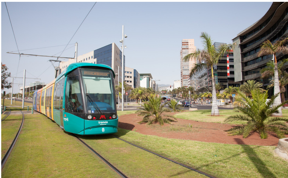
Nuestra red tranviaria tiene unos 63.000 metros cuadrados de césped.