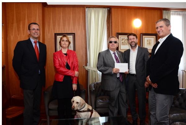
La cesión de bonos forma parte del convenio formativo que mantenemos con la ONCE para la correcta formación de sus afiliados.