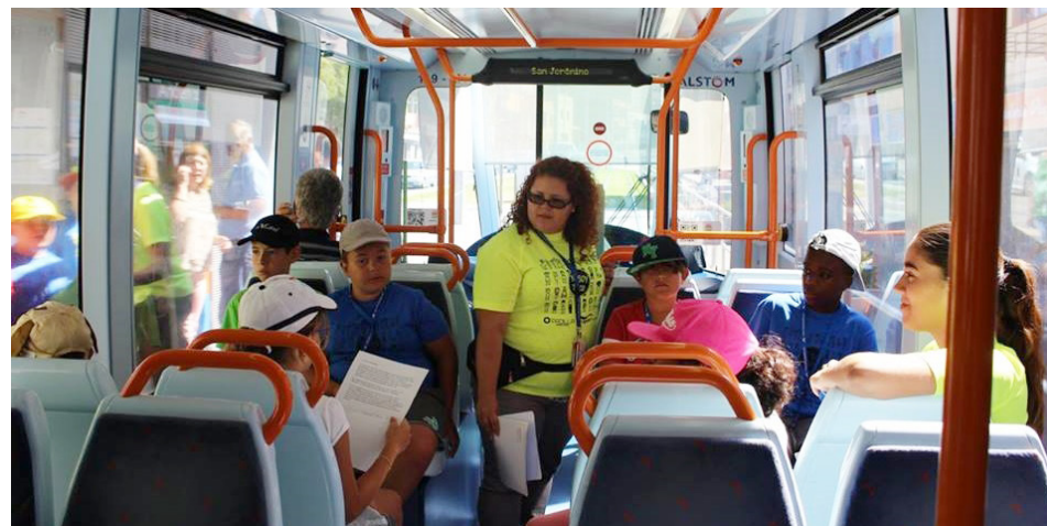
Colaboramos con la Escuela de Verano Yo soy Taco que parte del Proyecto de Intervención Comunitaria Intercultural.