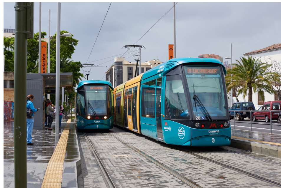
La demanda creció un 5 % respecto al 'Plenilunio Santa Cruz' de 2015.

Si bien se registraron más cancelaciones en horario de mañana, a partir de la tarde-noche se experimentó un ligero descenso del 6 % (-560 cancelaciones), en parte debido a que el tranvía, en horario nocturno, solo estaba operativo en una parte de la línea, hasta la parada Teatro Guimerá, por los actos que se realizaron en la zona La Concepción-Bravo Murillo.