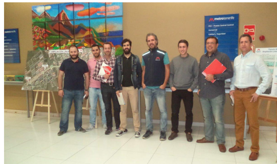
Nuestros compañeros de Informática e Ingeniería de Sistema explicaron el funcionamiento de SIMOVE a la delegación de Metro Ligero Oeste de Madrid.

Con la finalidad de que tuvieran un mayor conocimiento del sistema, les explicamos en detalle su funcionamiento técnico, las posibilidades de su potente Back Office, además de realizar demostraciones en vía.