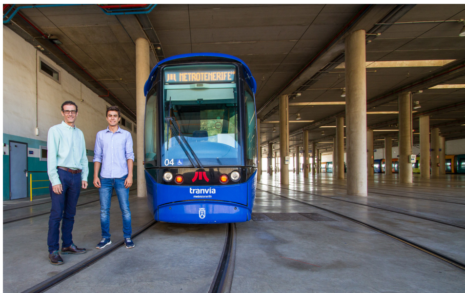
En Tenerife nuestra empresa se sumó a esta iniciativa formativa que también se ha celebrado en las ciudades de Barcelona, Tarragona, Madrid y Valencia.

La iniciativa persigue que los estudiantes tomen como referencia el esfuerzo, la dedicación y formación de los directivos, así como fomentar el emprendimiento y la iniciativa personal entre los jóvenes.