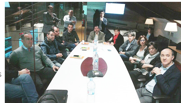
A la mesa de trabajo asistieron los comunicadores de principales operadores de transporte guiado de toda España.

La Fundación de los Ferrocarriles Españoles retomó los encuentros con los comunicadores del sector del transporte guiado a fin de reforzar los lazos entre los distintos equipos e intercambiar experiencias acerca de las necesidades y los últimos desarrollos en materia de comunicación.