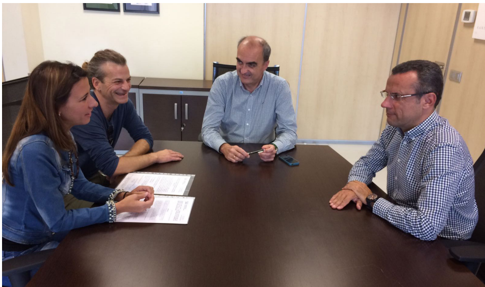
Las prácticas en nuestras oficinas mejorarán las habilidades laborales, personales y sociales de los usuarios del centro ocupacional Jáslem.

Los tres primeros alumnos en formación se encargaron del inventario y gestión del stock, del reparto del correo postal y de la gestión administrativa fundamental, cumpliendo correctamente con las tareas asignadas.