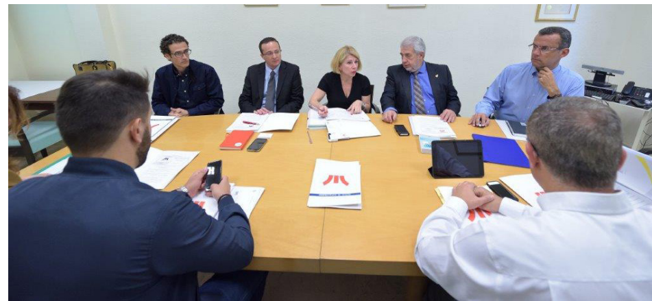
Contaremos con ocho nuevos vehículos eléctricos para labores auxiliares y de mantenimiento.