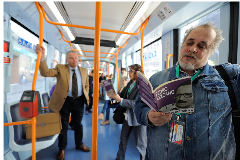
El 'Día de las Letras Canarias', dedicado al poeta Pedro Lezcano, se celebró en nuestros tranvías.