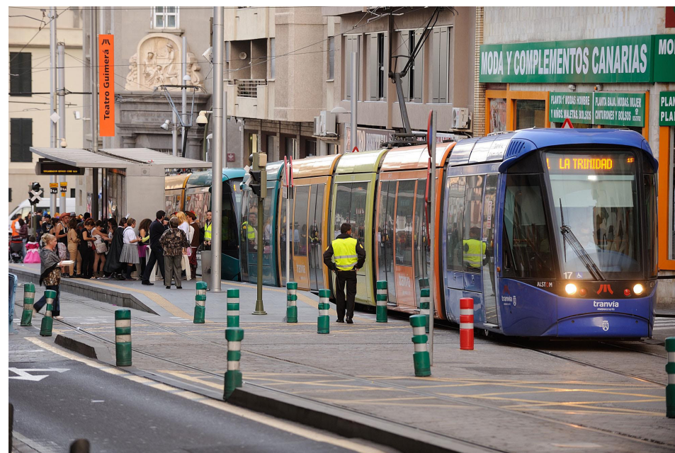
El Juzgado de lo Penal tuvo en cuenta el daño para la imagen de nuestro tranvía en una sentencia condenatoria por hechos violentos en uno de nuestros vehículos.

La reposición de nuestra buena imagen a través de las campañas de prevención contra la violencia la valoró el juez como parte de los costes que debieron sufragar los vándalos, algo novedoso en una sentencia y que consideramos muy positivo como respuesta ante este tipo de acciones antisociales.