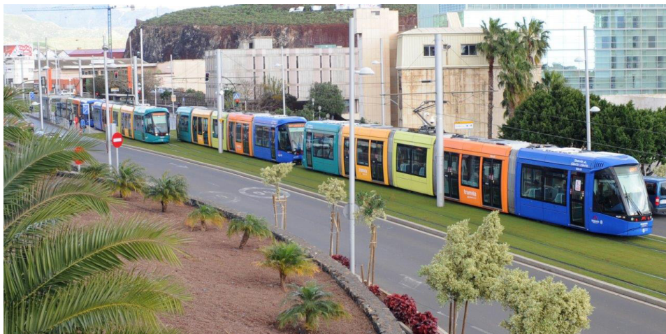
Vía Limpia y CLECE Servicios se encargarán de la limpieza de material móvil, talleres y cocheras y de la red tranviaria.

El Consejo también acordó una futura licitación para la adquisición de otros cuatro nuevos vehículos 100 % eléctricos para incorporar a su parque móvil.