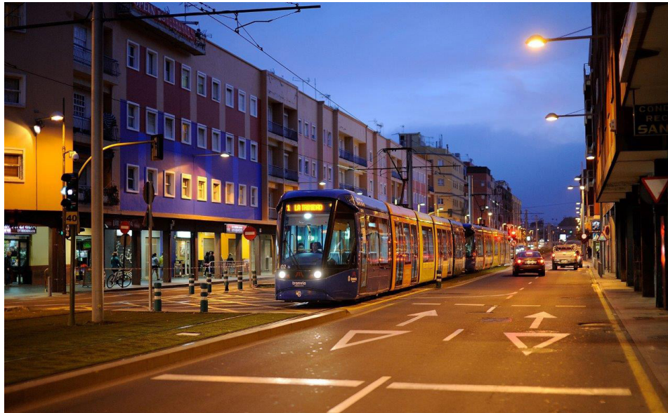
La demanda de 'La Noche en Blanco' de La Laguna rozó los 36.000 pasajeros.