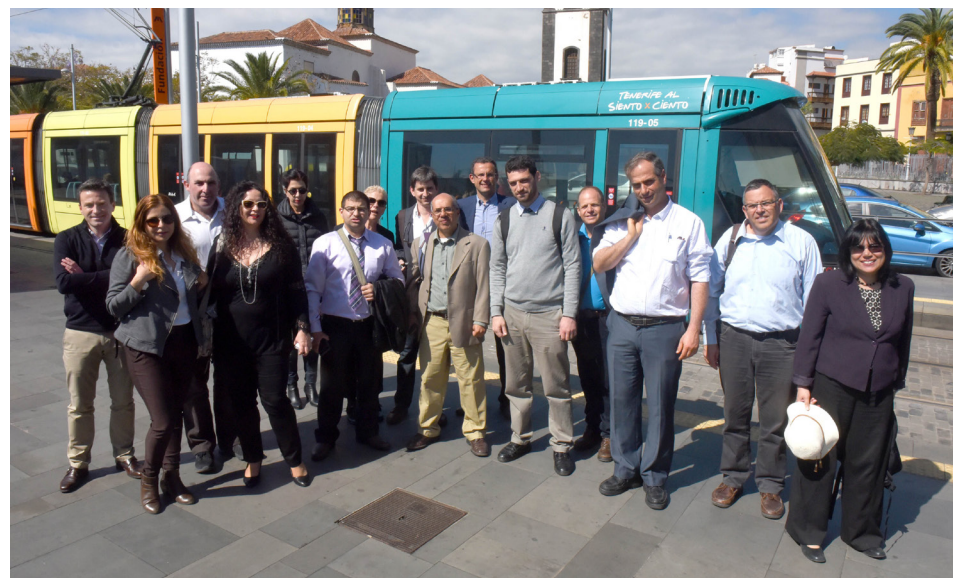
La delegación israelí se trasladó a Tenerife para conocer las características de nuestro tranvía como modelo de integración urbana.

Esta delegación ha visitado otras ciudades con tranvía como Barcelona, Oporto y Lisboa ya que el Gobierno israelí está trabajando en la ampliación de su sistema tranviario, que en la actualidad cuenta con una línea de 12 kilómetros.