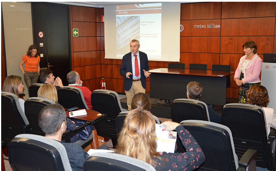
El segundo encuentro del Comité de Comunicadores se celebró en Bilbao.